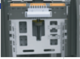
Kumaş kalınlığına göre yükseklik ayarı