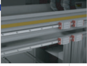
İkili rehber ray sistemi