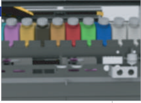
Çok renkli mürekkep tankları