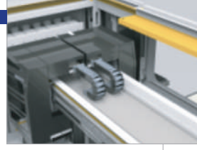
İki arabalı sistem